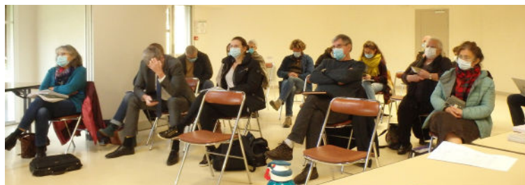
COPIL Natura 2000 de décembre

Jusqu'à maintenant, au moins 150 personnes ont participé à la consultation locale sous forme de groupes de travail, groupes techniques ainsi qu'un comité de pilotage constitué d'acteurs locaux (collectivités, acteurs socio-économiques, associations) et de services de l'Etat qui valide les grandes étapes. Plus de 30 entretiens socio-économiques ont été menés.