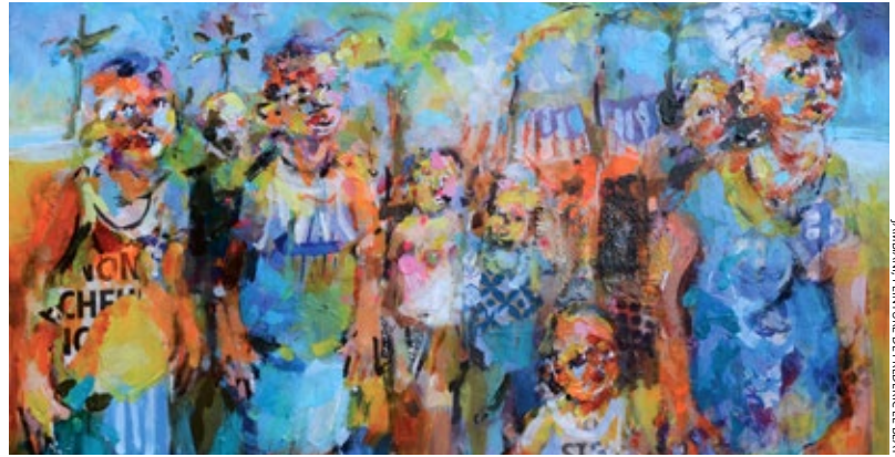
JAMBANI - PEINTURE DE FRÉDÉRIC LE BLAY

Frédéric Le Blay vous emmène en voyage à la Galerie municipale Bernard Nonnet jusqu'au 12 septembre ... à ne pas manquer !