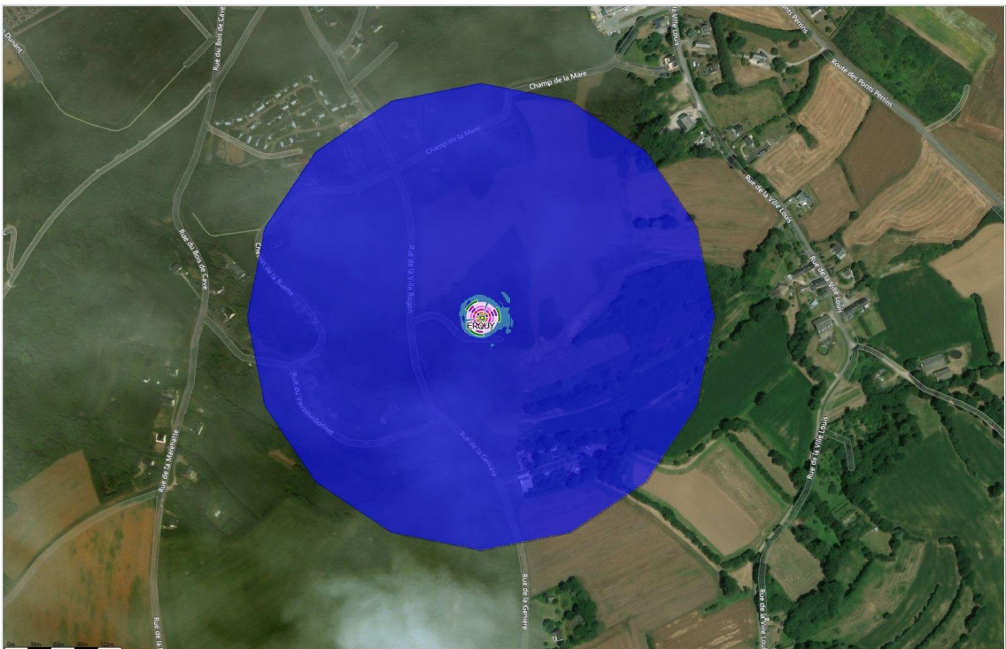
Fond de carte (photo aérienne), source : bing. Logiciel de simulation Cellerity, éditeur Orange Labs

À 1,5 m du sol, le niveau maximal simulé en intérieur pour les antennes à faisceau fixe est compris entre 2 et 3 V/m.