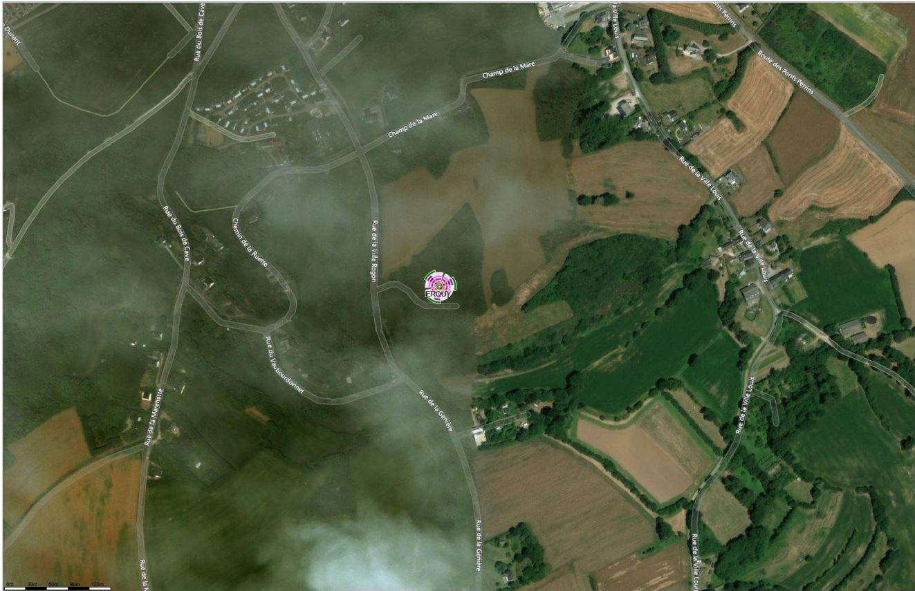
Fond de carte (photo aérienne), source : bing.