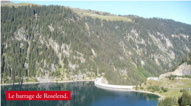
Le barrage de Roselend.