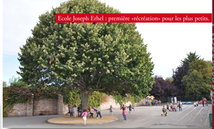
Ecole Joseph Erhel : première «récréation» pour les plus petits.

Côté projets, un partenariat est mis en place avec le Centre Nautique pour le Cycle 3, avec la piscine de Pléneuf pour les élèves de grande section (GS) jusqu'au CE2, ainsi qu'avec la Bibliothèque Municipale, la Cybercommune et la Galerie d'Art Municipale pour une exposition en mai. Enfin, le thème pédagogique retenu pour cette année sera «l'école de la forêt».