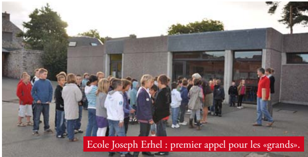
Ecole Joseph Erhel : premier appel pour les «grands».

Lundi 5 septembre était jour de rentrée scolaire. Dès 8h30 pour les élèves de l' Ecole Joseph Erhel et à 9h00 à l' Ecole Notre-Dame , ainsi que les classes de sixième du Collège Thalassa , les autres collégiens bénéficiant d'une journée de vacances supplémentaire pour faire leur rentrée mardi matin.