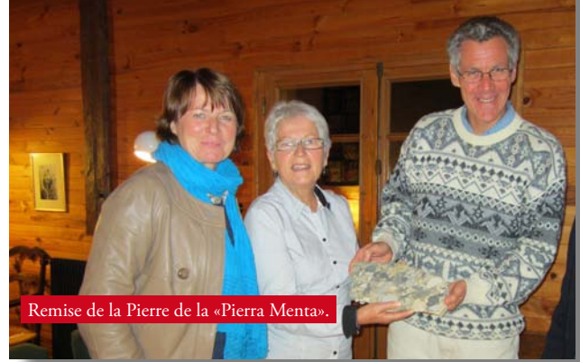
Remise de la Pierre de la «Pierra Menta».

Nous ne pouvons que vous inviter à aller découvrir cette superbe région où les chalets sont si beaux que l'on se croirait au pays d'Heidi, où les nombreux lacs sont des miroirs pour les forêts de sapins et où les marmottes se mettent au garde à vous pour mieux vous séduire. Dernier détail très révélateur : il y a des cœurs partout aux murs et aux fenêtres des chalets, des cœurs qui en disent long sur le caractère généreux et accueillant des savoyards d'Arêches-Beaufort.