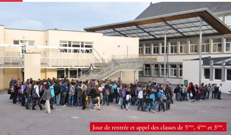
Jour de rentrée et appel des classes de 5 ème , 4 ème et 3 ème .