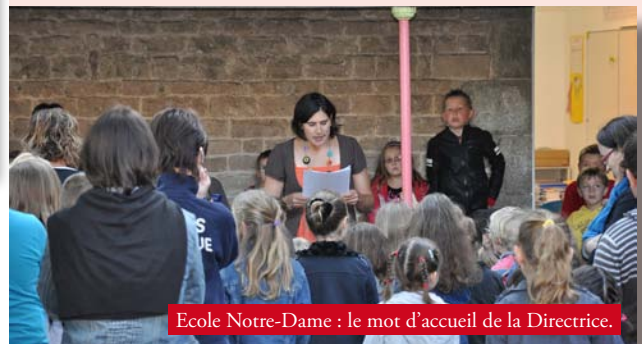
Ecole Notre-Dame : le mot d'accueil de la Directrice.

Un nouveau projet d'école est lancé à cette rentrée pour un cycle de 3 ans : «Vers la connaissance et le respect de notre environnement». Il sera décliné sur 3 années, et pour 2011 : «connaître notre environnement, notre lieu de vie». Un autre projet sur le thème de l'école du cirque amènera les enfants à travailler sur leur équilibre et sur leurs déplacements.