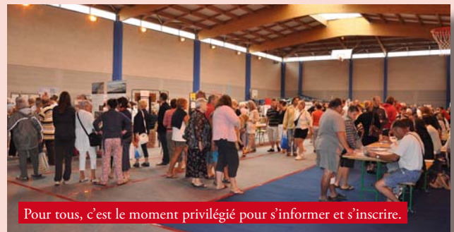
Pour tous, c'est le moment privilégié pour s'informer et s'inscrire.

Le Rendez-vous annuel qui lance la rentrée de septembre, le Forum des Associations s'est tenu samedi 3 septembre dans le gymnase Thalassa. Cinquante deux associations ont ainsi présenté leur activité aux réginiens, venus en nombre.