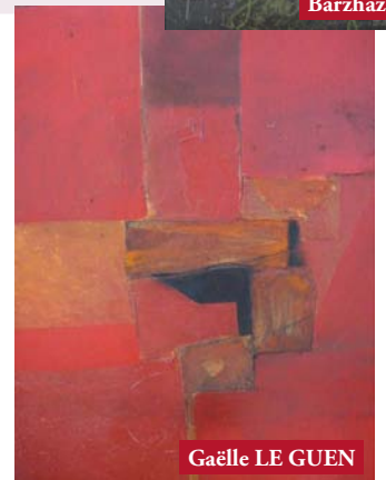
Gaëlle LE GUEN