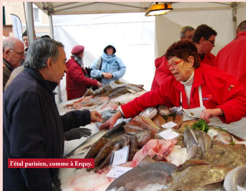
L'étal parisien, comme à Erquy.

Belle réussite pour le marché d'hiver, installé place des Abbesses en plein coeur d'un quartier commerçant. Le stock de coquilles Saint-Jacques apporté sur place a trouvé preneur en quelques heures sur les différents étals, proposant aussi poissons de nos côtes et huitres. Malgré un temps froid mais clément, les dégustations de nos produits locaux ont ravi les curieux d'un jour, comme les habitués de la quatrième édition de ce rendez-vous des Côtes d'Armor à Paris. Le stand de l'Office de Tourisme a affiché complet et a permis de faire connaître à de nombreux parisiens notre petit coin de Bretagne.