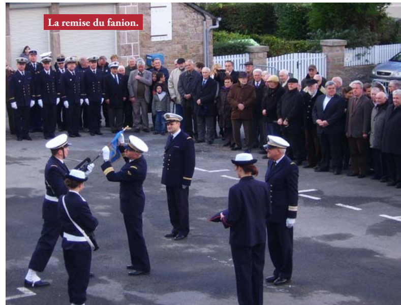
La remise du fanion.

La Préparation Militaire Marine (PMM) de Saint Quay Portrieux a ouvert ses portes en 1975. Elle forme les futurs réservistes et engagés de la Marine Nationale. Tous les ans, elle accueille plus d'une vingtaine de stagiaires (filles et garçons) de 16 à 23 ans. Cette année 2009-2010, elle est composée de 27 stagiaires dont 4 filles, et c'est Erquy qui a été choisi pour recevoir la cérémonie de remise du fanion, ce samedi 12 décembre 2009, en présence des autorités militaires, des élus locaux, des portedrapeaux des anciens combattants du département, des familles des jeunes. Une cérémonie inhabituelle pour notre port de pêche, et qui a rassemblé aussi de nombreux réginiens.