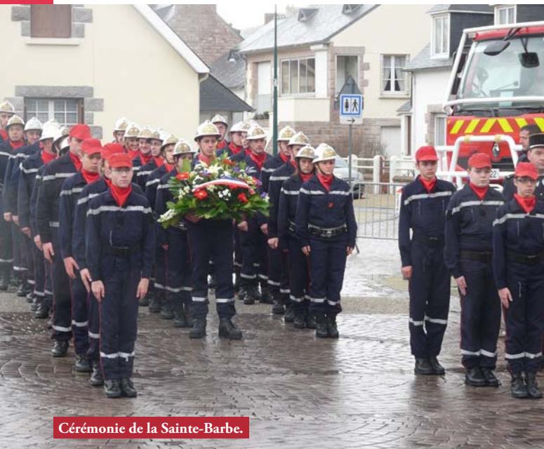
Cérémonie de la Sainte-Barbe.

Enfin, nous adressons nos plus vifs remerciements aux pompiers de Lièges qui ont fait le déplacement à Erquy pour venir célébrer avec nous notre Sainte Barbe.