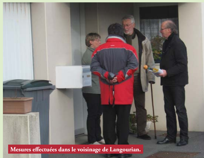
Mesures effectuées dans le voisinage de Langourian.

Des résidents proches du site TDF sur le Château d'Eau de Langourian, ont manifesté une certaine inquiétude après avoir regardé une émission de télévision où il était fait état de la dangerosité des champs magnétiques émis par les installations radioélectriques ou par les équipements utilisés dans les réseaux de télécommunication.