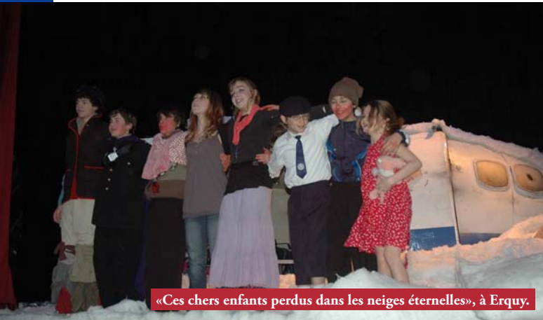
«Ces chers enfants perdus dans les neiges éternelles», à Erquy.

Après l'excellente prestation de la Compagnie des Enfants Perdus en décembre dernier, l'Ancre des Mots vous propose quatre nouveaux rendez-vous : théâtre, chanson, jazz, ... de quoi passer de bons moments.