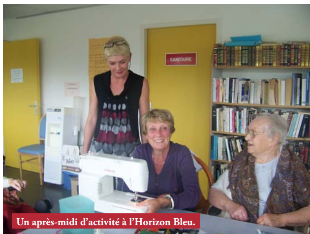
Un après-midi d'activité à l'Horizon Bleu.

La bonne nouvelle à Cap Amitié, c'est que nous avons soufflé notre première bougie. Notre existence officielle date de décembre, même si nous avons commencé à fonctionner le premier septembre 2008. Nous étions neuf membres au départ, nous sommes aujourd'hui quatorze. Cap Amitié continue donc sur sa lancée avec ses cinq ateliers : chant, bricolage, atelier-mémoire, lecture-discussion, jeux de société.