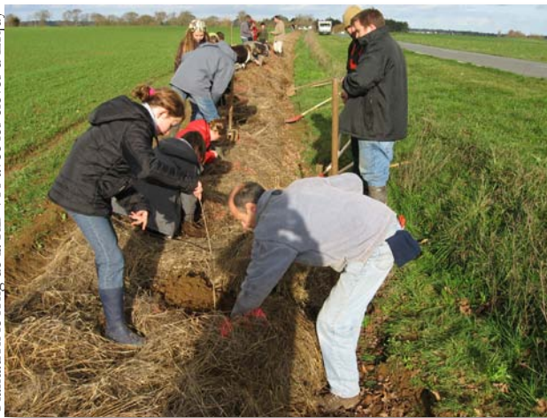
Plantation le long de la RD 786 avec les élèves d'Erquy

mais de reconstituer un bocage répondant à la fois aux exigences environnementales et agricoles.