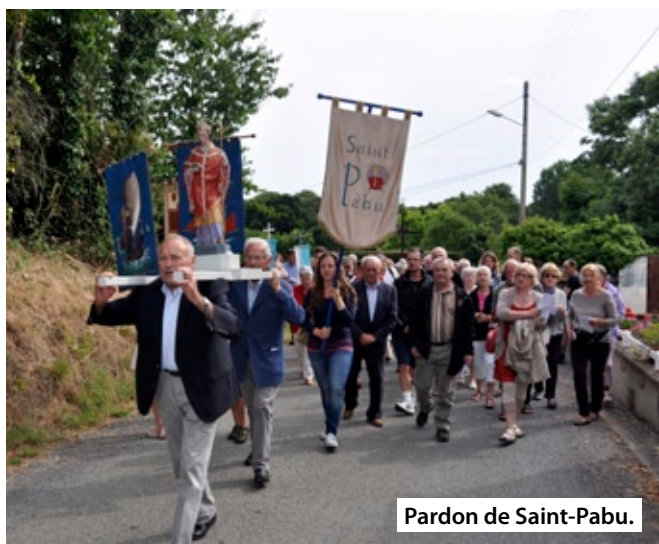
Pardon de Saint-Pabu.

Créée par la loi du 2 juillet 1996, reconnue d'utilité publique , la Fondation du Patrimoine est, aux côtés de l'État et des principaux acteurs du secteur, un partenaire de l'engagement culturel local et un moteur