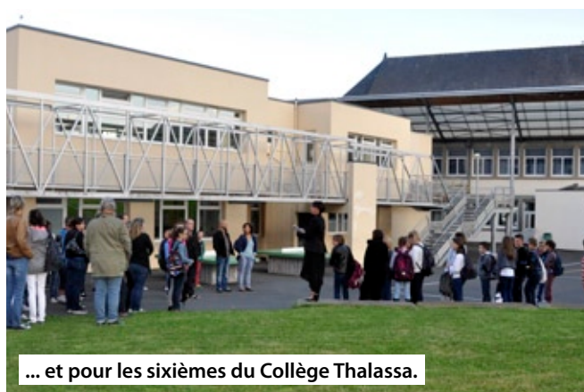
... et pour les sixièmes du Collège Thalassa.

Pour les autres projets (liste non exhaustive) :