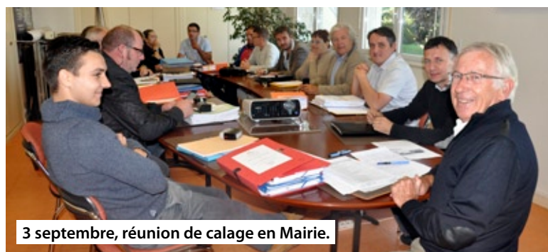
3 septembre, réunion de calage en Mairie.

Ne pouvant plus continuer leur activité dans le gymnase, elles ont déménagé leur matériel fin août et se sont réinstallées dans d'autres salles mises à leur disposition. Une réunion d'informations a eu lieu le 22 juin pour trouver une solution de remplacement et pour que chacune puisse pratiquer sa discipline dans les meilleures conditions. Les salles ont été attribuées en fonction des contraintes liées aux disciplines, par exemple un sol parquet pour les danseuses de Modern Jazz et les karatékas de Budokan ou un gymnase pour les joueurs de Handball et de Badminton.