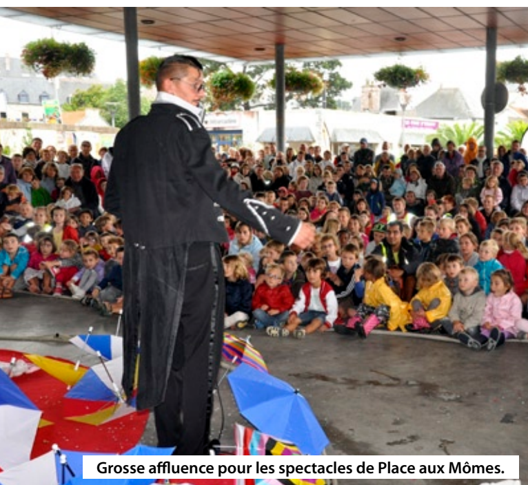
Grosse affluence pour les spectacles de Place aux Mômes.

Si le soleil ne nous a pas toujours accompagnés durant cette saison estivale, nous avons pu cependant nous réchauffer chaque mercredi devant des concerts celtiques aussi variés que colorés. Autour de bretons et aussi de polonais, de québécois ou d'occitans, les sons firent vibrer nombre de spectateurs et de danseurs. Même s'il fallut parfois se réfugier sous la Halle, la pluie et la fraîcheur n'empêchèrent pas les adeptes de prendre beaucoup de plaisir.