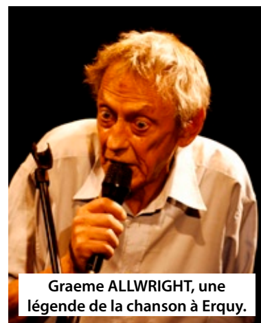
Graeme ALLWRIGHT, une légende de la chanson à Erquy.