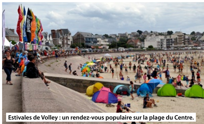
Estivales de Volley : un rendez-vous populaire sur la plage du Centre.

L'été a été marqué par de belles manifestations sportives, des temps forts dans notre saison estivale. Cela a commencé par le plus grand tournoi européen de volley de plage, les Estivales de Volley , du 20 au 22 juillet. Du beach volley en continu et apprécié de tous ! Pendant ces trois jours, on pouvait croiser polonais, italiens, hollandais ... et certaines équipes se sont déjà inscrites pour le tournoi de 2016 !