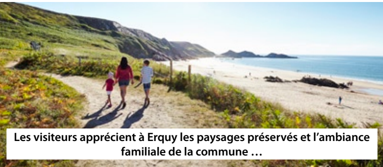
Les visiteurs apprécient à Erquy les paysages préservés et l'ambiance familiale de la commune ...

La saison 2015 a été globalement positive car elle a bénéficié de bons atouts cette année : un calendrier d'avant saison favorable, les grosses chaleurs régnant dans d'autres régions, la médiatisation de la Bretagne via de beaux reportages sur les chaînes de télévision nationales, sans oublier la satisfaction des vacanciers lors des saisons précédentes.