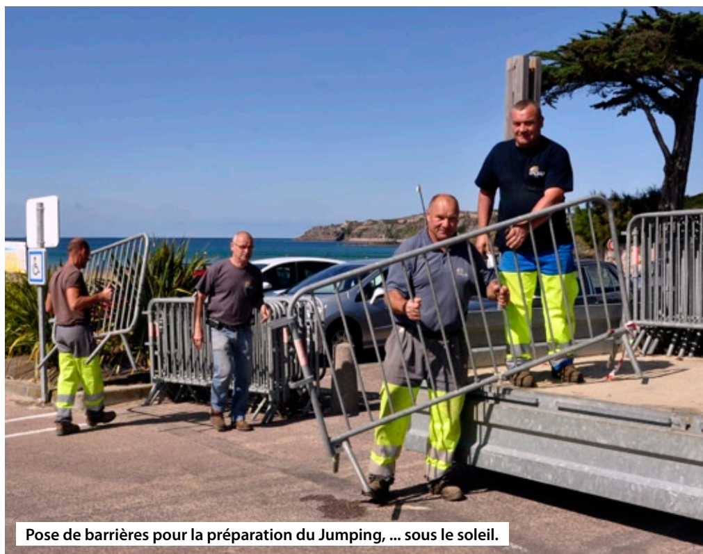
Pose de barrières pour la préparation du Jumping, ... sous le soleil.

une semaine entière de préparation pour 15 employés ce qui représente, en heures cumulées, pas moins de 220 heures de montage et 180 heures de démontage. Une autre manifestation importante pour notre station, ce sont Les Estivales de Volley qui, elles, nécessitent 50 heures de démontage (le montage étant effectué par l'association) après la dernière rencontre, le soir, et ce jusque 23h00. Le lendemain matin, il faut transporter le matériel sur la ville de Saint-Cast. La dernière des « grosses » manifestations est le Jumping Erquy Plage , en septembre. De plus, sur notre ville cet été, on a dénombré 17 manifestations organisées par des associations, auxquelles on a rajouté 9 « Mercredis Celtiques », 7 « Artisan'Halles », 7 « Place aux Mômes », 9 « vide-greniers ».