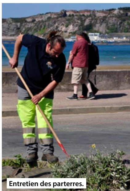
Entretien des parterres.

Il est une équipe à laquelle on ne pense pas toujours, qui œuvre dans l'ombre, tôt le matin, tard le soir, tous les jours ou presque : ce sont les employés communaux. Pour pouvoir répondre aux très nombreuses demandes des associations et de la ville, ils montent, démontent et transportent les barnums, scènes, stands, bancs, tables et autres matériels tout au long de la saison, de mai à septembre. En effet, la manifestation Landes & Bruyères, Cap d'Erquy - Cap Fréhel , fin avril/début mai, demande