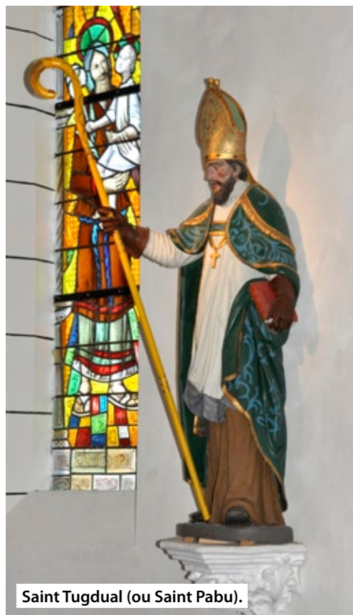
Saint Tugdual (ou Saint Pabu).

Fondation du Patrimoine WWW.BRETAGNE.FONDATION-PATRIMOINE.ORG Fondation reconnue d'utilité publique Loi du 2 juillet 1996