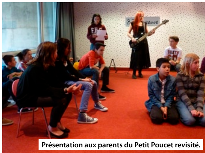
Présentation aux parents du Petit Poucet revisité.