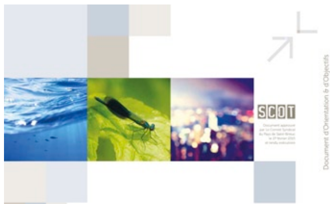
SCHÉMA DE COHÉRENCE TERRITORIALE le SCOT du Pays de Saint-Brieuc est exécutoire

Le Schéma de Cohérence Territoriale SCOT a été approuvé par les élus du Pays de Saint-Brieuc le 27 février 2015. Suite à sa transmission au Préfet des Côtes d'Armor, il est exécutoire depuis le 10 mai 2015. De ce fait, le SCOT du Pays de Saint-Brieuc s'applique sur les 63 communes du territoire et est opposable aux documents d'urbanisme locaux, aux zones d'aménagement concerté, aux autorisations d'exploitation commerciale et à certaines opérations foncières.