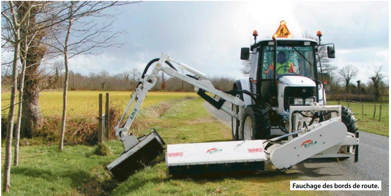
Fauchage des bords de route.

Les dépendances vertes des routes départementales représentent une superficie totale d'environ 4 500 ha qui constitue un milieu naturel refuge pour la faune et la flore.