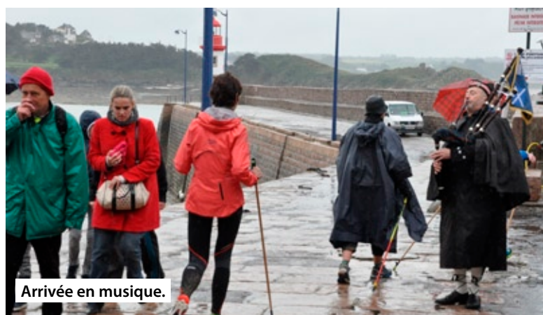
Arrivée en musique.