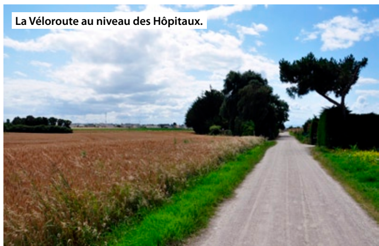
La Véloroute au niveau des Hôpitaux.