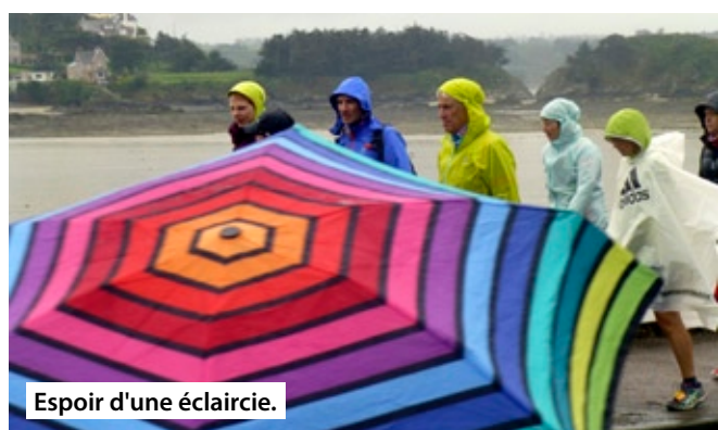
Espoir d'une éclaircie.

on s'est tous mouillés pour notre course