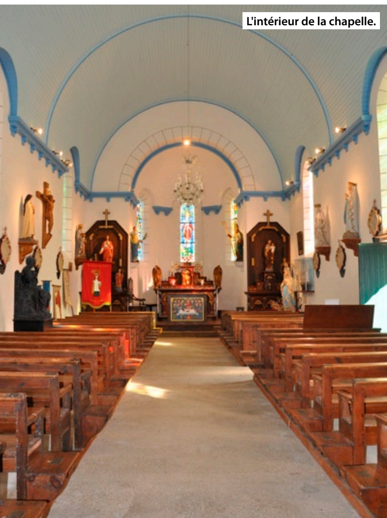
L'intérieur de la chapelle.

Située en Erquy dans le village de Saint-Pabu, elle se présente sous la forme d'un édifice rectangulaire à deux pignons aiguille. Le pignon Ouest, cantonné de contreforts, est surmonté d'un campanile en pierre de taille. Il s'ouvre sur la route par une porte en plein cintre surmonté d'un œil de bœuf. Le pignon Est est surmonté d'une petite croix en granit gris provenant de l'ancienne chapelle. Il s'ouvre sur un arc diaphragme et une absidiole en « cul de four ». Les deux murs Sud et Nord sont renforcés de quatre contreforts amortis, s'arrêtant au-dessous de la sablière de pierre.