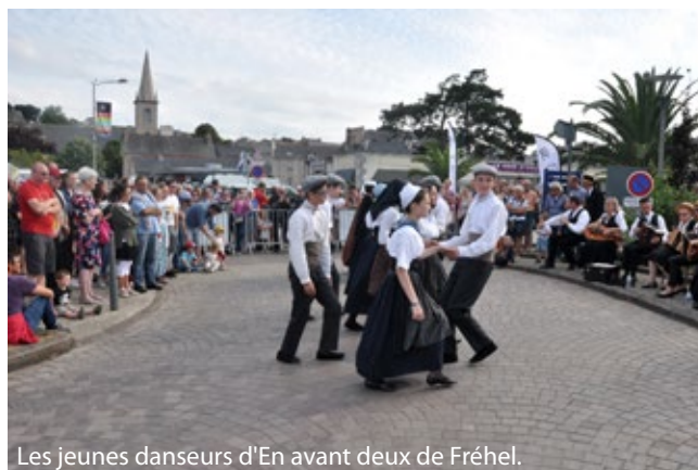
Les jeunes danseurs d'En avant deux de Fréhel.

Le festival des arts vivants de rue, Place aux mêmes a lui aussi attiré, comme toujours, de nombreux enfants et leurs parents, grands-parents ou animateurs. Sept spectacles de qualité ont encore ravi petits et grands. L'esplanade des drapeaux a accueilli deux spectacles qui techniquement, ne pouvaient pas se produire sous la Halle, le lieu habituel. Et là également, cet espace extraordinaire a émerveillé les artistes et le public des adultes. La magie de cette esplanade est évidente. Seuls le vent et la pluie peuvent la briser.