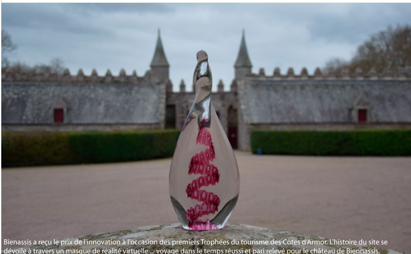
Bienassis a reçu le prix de l'innovation à l'occasion des premiers Trophées du tourisme des Côtes d'Armor. L'histoire du site se dévoile à travers un masque de réalité virtuelle ... voyage dans le temps réussi et pari relevé pour le château de Bienassis.