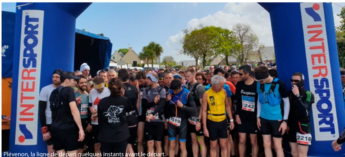
Plévenon, la ligne de départ quelques instants avant le départ.