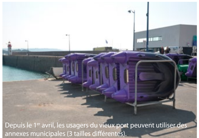
Depuis le 1 er avril, les usagers du vieux port peuvent utiliser des annexes municipales (3 tailles différentes).