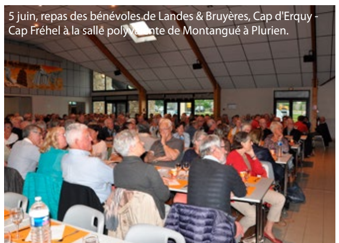
5 juin, repas des bénévoles de Landes & Bruyères, Cap d'Erquy - Cap Fréhel à la salle polyvalente de Montangué à Plurien.