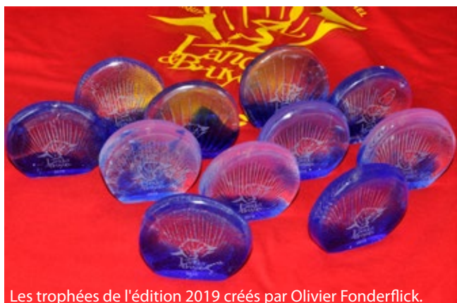
Les trophées de l'édition 2019 créés par Olivier Fonderflick.

Landes & Bruyères bénéficie du soutien du Conseil départemental des Côtes d'Armor et des communes de Fréhel, Plévenon et Plurien, ainsi que de partenariats avec des entreprises locales et nationales.