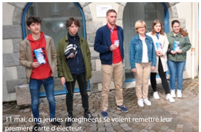
11 mai, cinq jeunes rhocéphins se voient remettre leur première carte d'électeur.