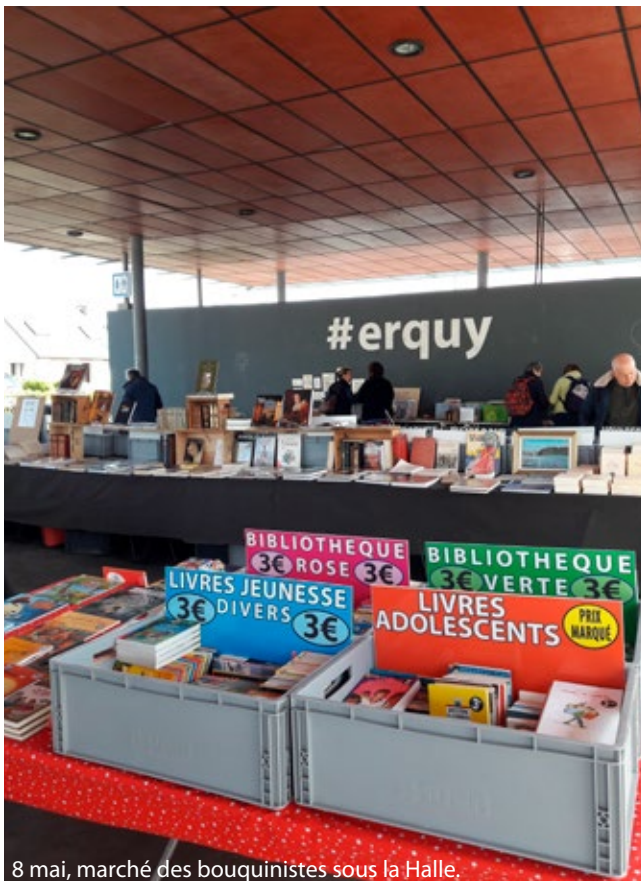
8 mai, marché des bouquinistes sous la Halle.