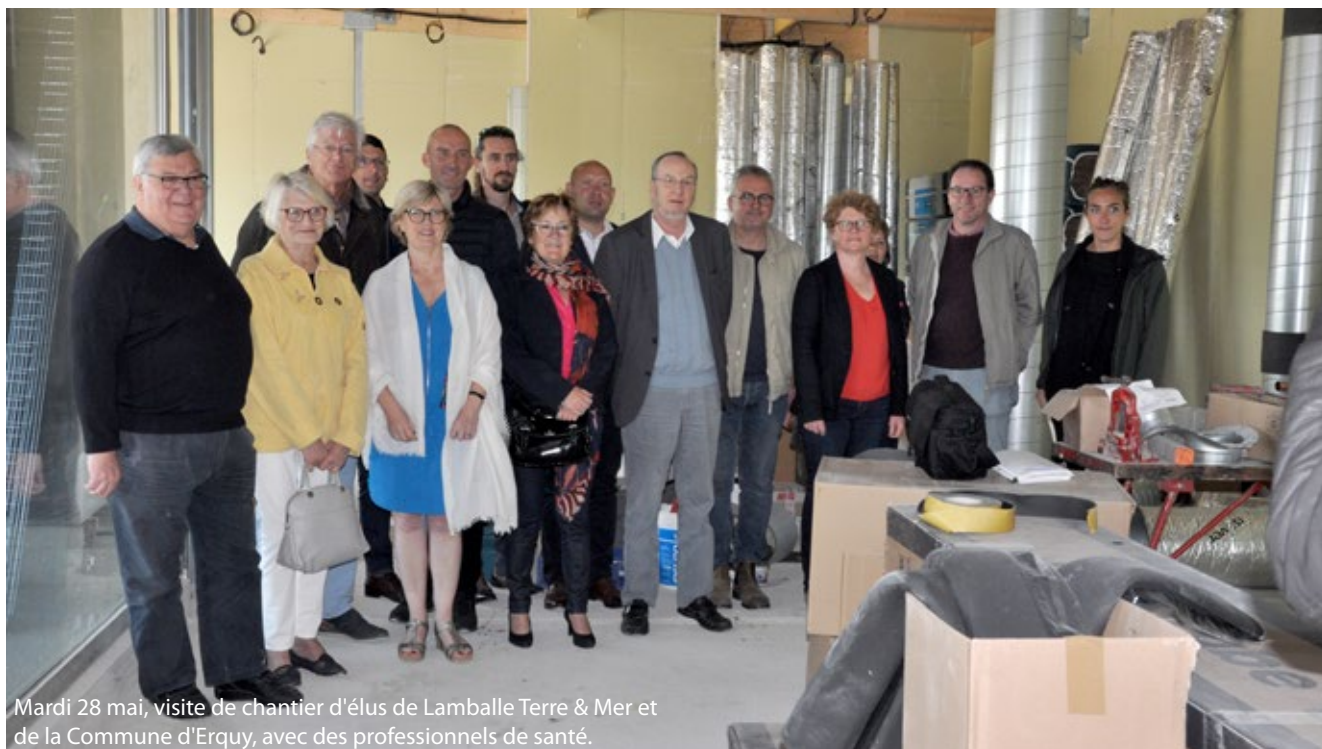
Mardi 28 mai, visite de chantier d'élus de Lamballe Terre & Mer et de la Commune d'Erquy, avec des professionnels de santé.

Ce n'est un secret pour personne, notre Maison de Santé située au 2 rue des Ponts Perrins, face à la chapelle des Marins, ouvrira ses portes en septembre après plus de dix ans de recherches, de travail, de négociations entre les différents acteurs : élus, professionnels de santé, Agence Régionale de Santé (ARS) .