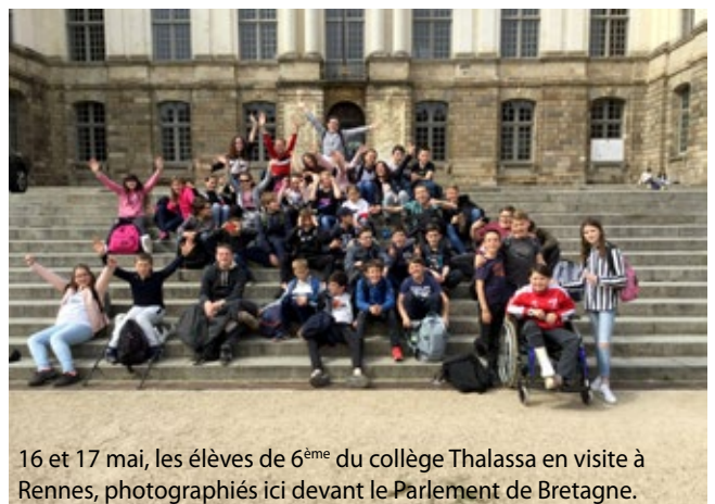
16 et 17 mai, les élèves de 6 ème du collège Thalassa en visite à Rennes, photographiés ici devant le Parlement de Bretagne.